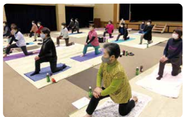
▲伸び伸びとヨガを楽しむ部員

部員は4色のテープでつくられたはしご状の道具「コグニラダー」を使い、決められた色や手順で足踏み・手拍子をするエクササイズなどに挑戦。互いに声をかけ合っ