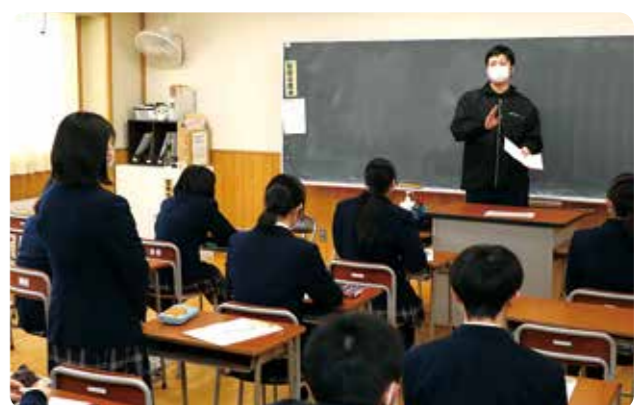
▲高校生からの質問に答える職員

受講生は、ナシゴレンやアサリと鶏肉だんごのエスニックスープ、エスニックサラダに挑戦。また、バレンタインデーに向けて焼き菓子のクラシックショコラもつくり、家に持ち帰って味わいました。