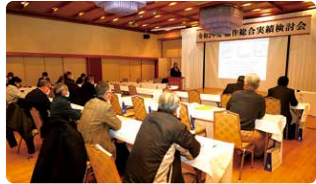
▲雑草防除について学ぶ参加者

写真の講座では、参加者がスマートフォンやカメラを使った農産加工品の撮影を実践。物の配置や撮る角度、照明や反射板の使い方などを教わりながら、商品を魅力的にPRするコツを学びました。