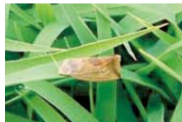
イネアオムシの成虫

今年の発生量はやや多いと予想されます、発生が多い場合は、イネの葉が食害され生育の遅れや登熟不良などを引き起こします。前年多発した圃場ではフェルテラ箱粒剤またはルーチンアドスピノ箱粒剤で防除してください。